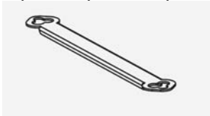
Separador espalda con espalda