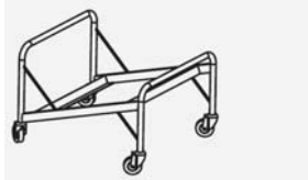
Chariot de transport

Dimensions: 67 x 61,5 x 49 cm Empilabilité: 25