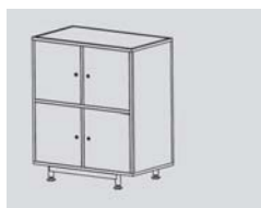
Unité avec serrure