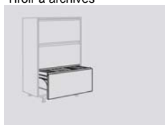
Tiroir à archives