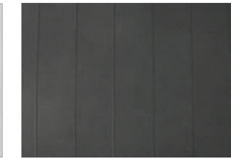
Negro / Black NCS S8502-Y