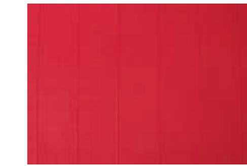
Rojo / Red NCS S2070-R