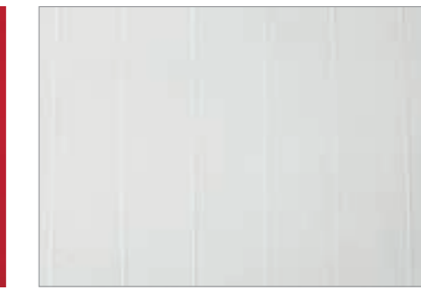
Blanco / Offwhite NCS S1002-Y