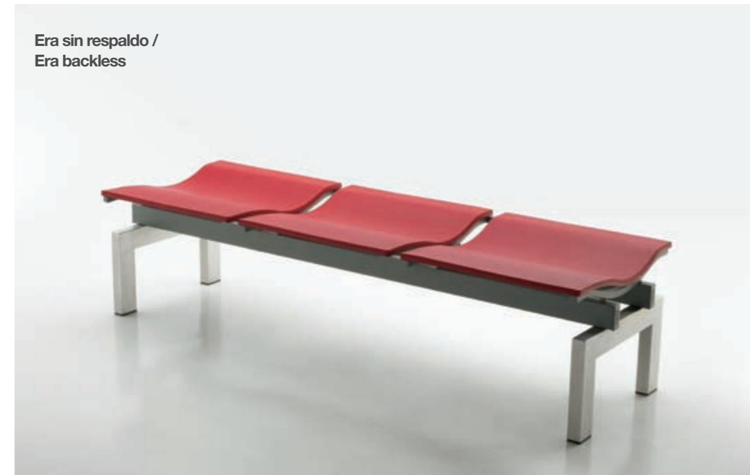
Era sin respaldo / Era backless