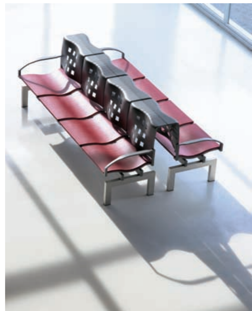
Posibilidad colocación espalda-espalda con posición fija de separación / Back to back installation with fixed distance position.