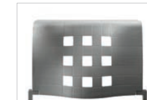
Antracita / Anthracite