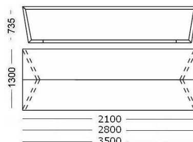
Table de Réunion avec plateau double 210x130 cm 280x130 cm 350x130 cm