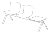
Table Carrée Centrale