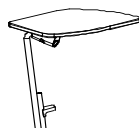
Anti-Panik-Schreibtablar Maße: 29,7 x 21 x 1,2 cm