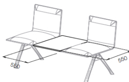
Zentraler quadratischer Tisch