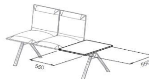
Table Carrée Latérale