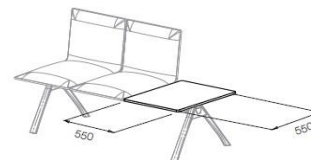
Mesa Cuadrada Lateral