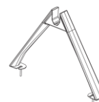
Sujeción al suelo