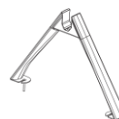
Sujeción al suelo