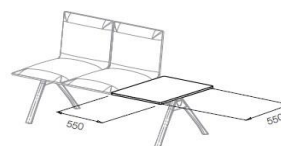
Mesa Cuadrada Lateral