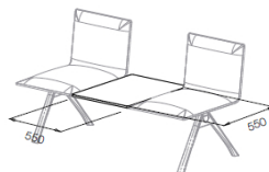
Zentraler quadratischer Tisch