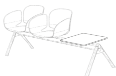
Sujeción al suelo