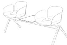
Separador a la pared