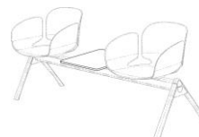
Separador a la pared