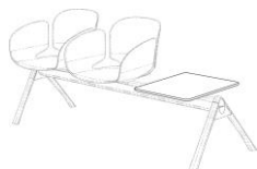
Sujeción al suelo